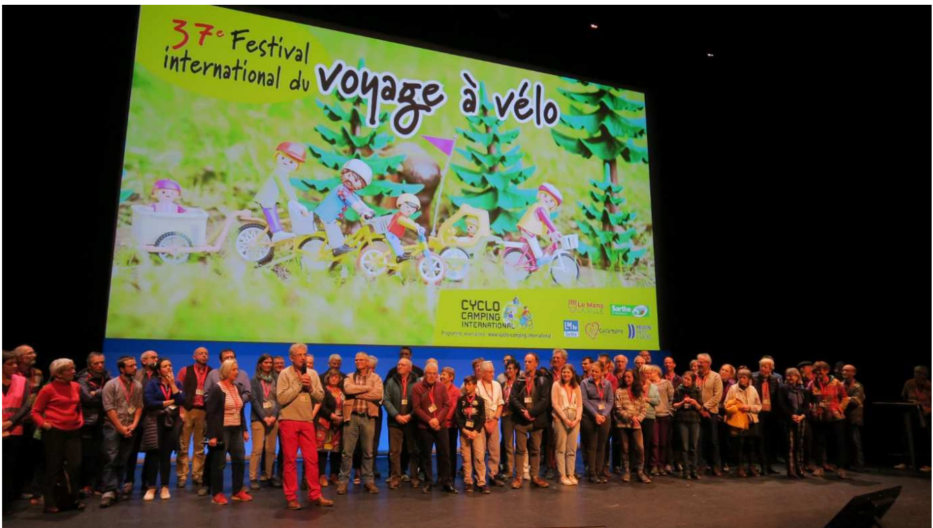
Une partie de l'équipe de bénévoles du festival précédent

Nos cent et quelques bénévoles sont déjà en ordre de marche et nous battons le rappel au Mans pour compléter les équipes.